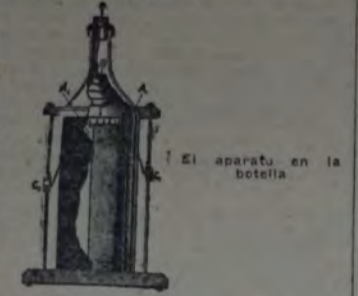
El aparato en la botella